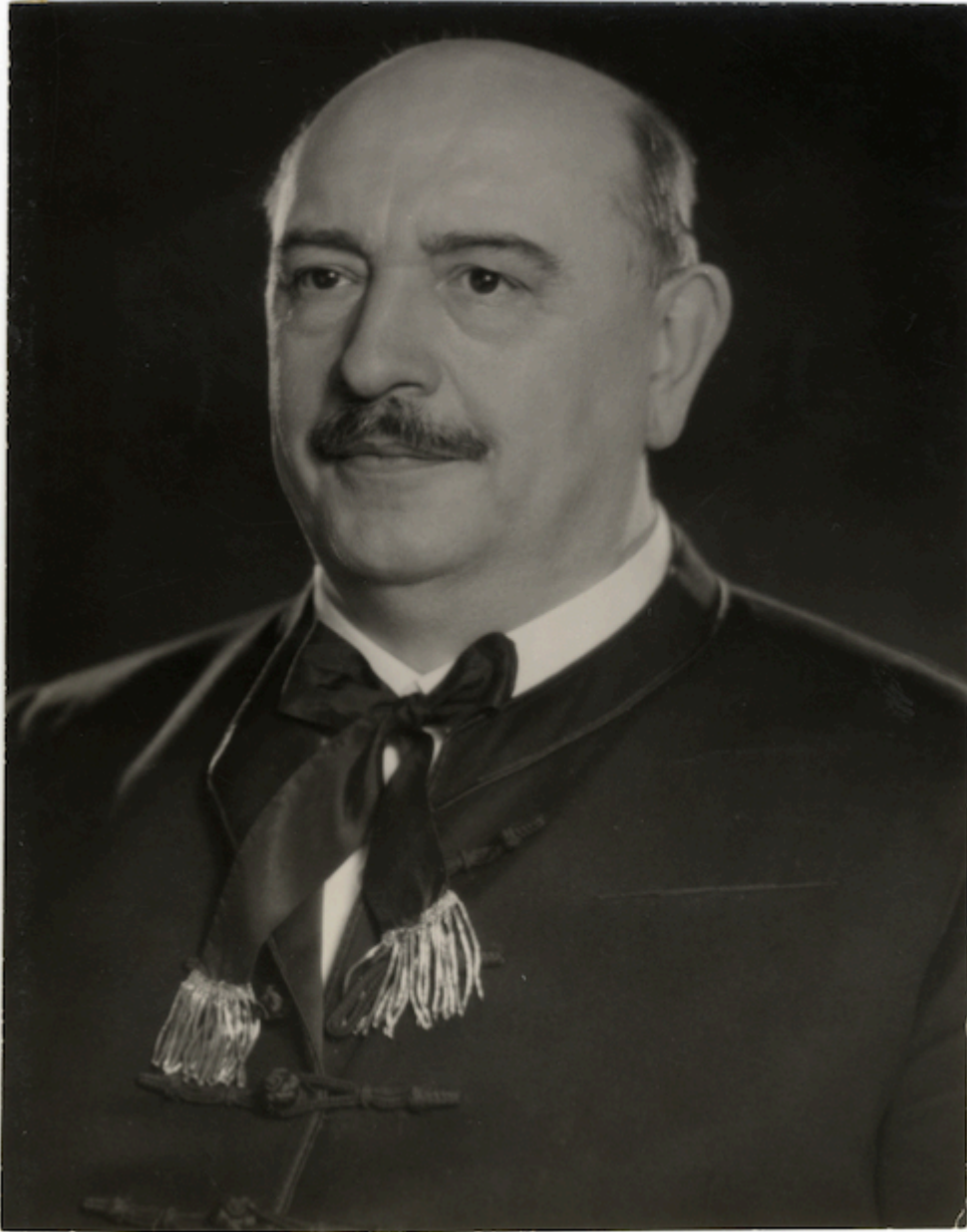
Hóman Bálint kultuszminiszter 1935 körül

A Gyűjteményegyetemet Klebelsberg Kunó hozta létre, s az intézmény addig maradt ebben a formában, míg életre hívója a kulturális tárca élén állt. 1931-ben a Bethlen István vezette kormány lemondásával Klebelsberg is távozott a miniszteri székből, Károlyi Gyula kormányába pedig már nem kapott meghívást. Utóda Gömbös Gyula kormányában 1932. október 1-től Hóman Bálint lett, aki Klebelsberg halálát (1932) követően új törvényjavaslatot terjesztett elő, melyből az 1934. évi VIII. törvénycikk született meg, átszervezést és változásokat hozva a Gyűjteményegyetem szervezetében.