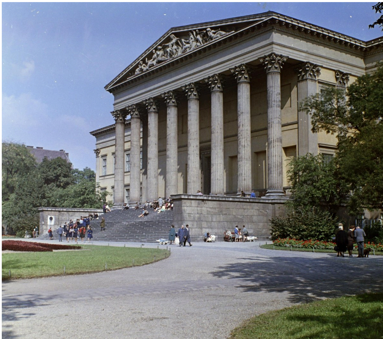
A Magyar Nemzeti Múzeum 1962-ben

Újabb változás 1963-ban következett be, mikor a 9. törvényerejű rendelet meghagyta ennek az öt múzeumnak az önállóságát, a Magyar Nemzeti Múzeum elnevezés pedig csak a mai Nemzeti Múzeumra vonatkozott.