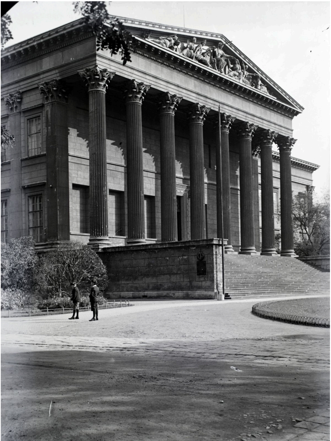
A Magyar Nemzeti Múzeum 1928-ban

A trianoni békediktátumot követően 1922. június 16-tól kilenc éven át minden idők egyik legkiemelkedőbb kultúrpolitikus, Klebelsberg Kunó lett a Vallás- és Közoktatásügyi Minisztérium vezetője, aki nagyszabású reformokat hajtott végre Magyarország tudományos, kulturális életében. Az ország súlyos területi veszteségeit, a magyar szellemi élet olimposzi magasságokba történő emelésével próbálta meg enyhíteni és kompenzálni. 1922-ben erről a következőket mondta: „A magyar hazát ma