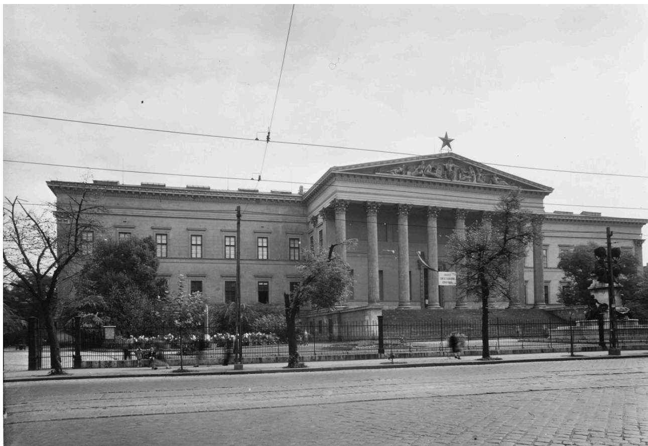
A Magyar Nemzeti Múzeum 1953-ban

A következő öt intézmény tartozott ebbe az új közgyűjteményi együttesbe: a Magyar Királyi Országos Levéltár közös címébe foglalt Kormányhatósági Levéltár és Magyar Nemzeti Múzeum Levéltár, az Országos Széchényi Könyvtár, az Országos Magyar Szépművészeti Múzeum, a Magyar Történeti Múzeum közös címébe foglalt Régészeti-Történeti-Iparművészeti Gyűjtemények és Néprajzi Múzeum, az Országos Természettudományi Múzeum, valamint a Közgyűjtemények Országos Főfelügyelőisége. Tehát a Magyar Nemzeti Múzeum ettől kezdve nem magát az intézményt, hanem az újonnan életre hívott, a Gyűjteményegyetem örökébe lépő, szintén közgyűjteményekből álló, autonóm szervezeti egységet jelölte, a Nemzeti Múzeum neve pedig ebben a formációban Magyar Történeti Múzeumra változott, melyhez a Néprajzi Tárból Néprajzi Múzeummá váló szakgyűjtemény is hozzátartozott.