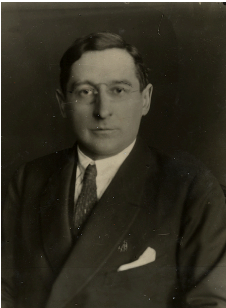
Klebelsberg Kunó miniszter portréja 1920 körül

elsősorban nem a kard, hanem a kultúra tarthatja meg és teheti ismét naggyá.” Ennek a kulturális elképzelésnek a része volt a közgyűjteményi intézmények reformja, a legnagyobb kulturális intézményeknek egyetlen önkormányzati testületben történő egyesítése.